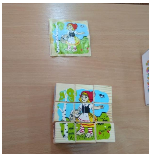
Настольно-печатные игры: «По дорогам сказок»