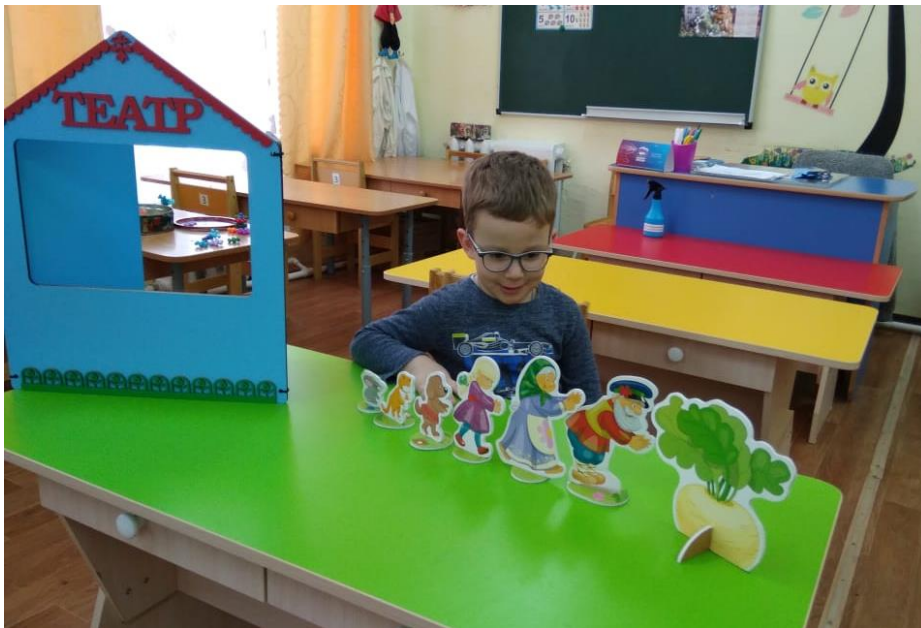
Дети принесли из дома книги со своими любимыми сказками