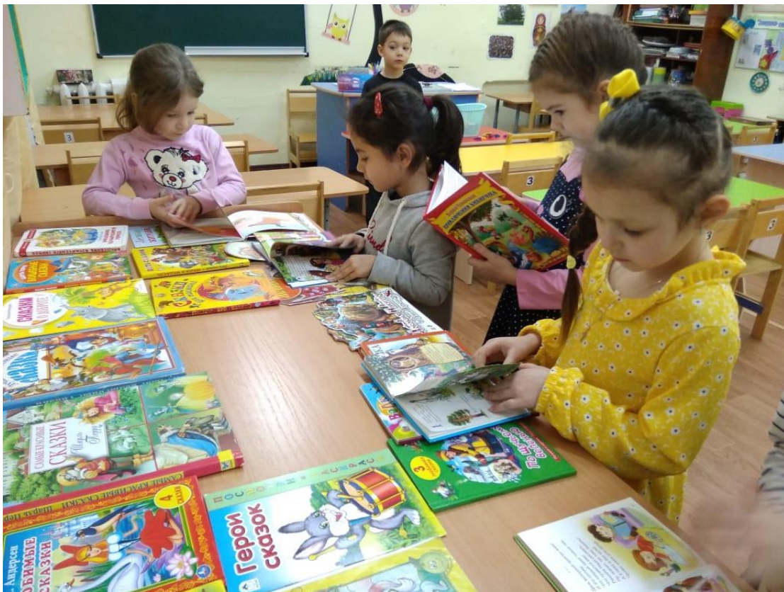
Чтение сказок перед дневным сном.