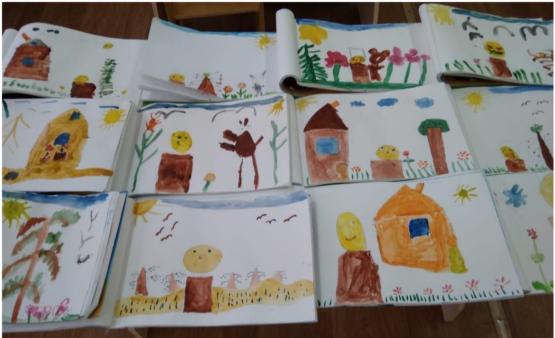
Раскраски «Мои любимые сказки», «Раскрась и назови, что за сказка».